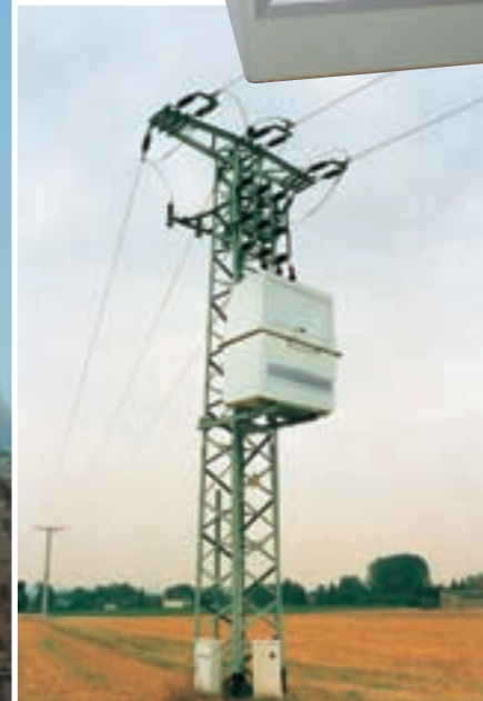
ELSIC - Transformatorboxarna går att få i tre olika storlekar (se tabell).